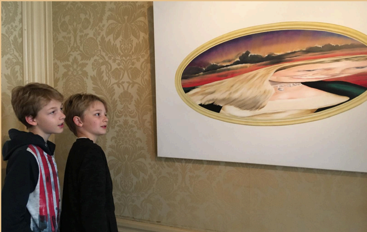
Museum Bredius November 2017