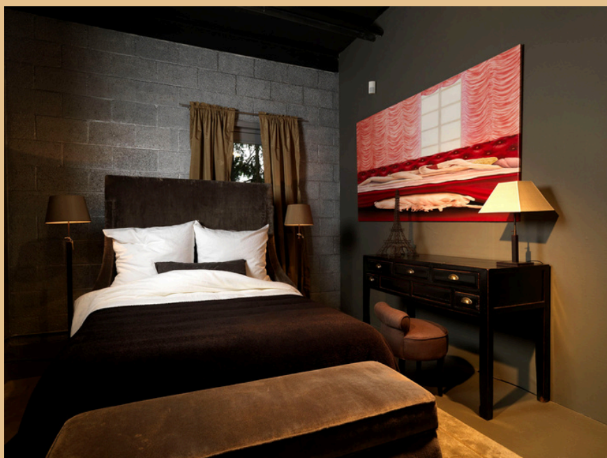
Showroom Brugman Landsmeer oktober 2017